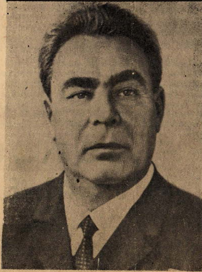
Avrupa Güvenliği ve İş-Birliği konferansını ilk öne süren Sovyetler Birliği olmuştur. Sovyetler Birliği Komünist Par-

Dünyada kurulan ilk sosyalist ülkenin birinci işi bütün ülkelere barış çağırısı yapmak olmuştur. Bu ilk barış çağırısından sonra başta Sovyetler Birliği olmak üzere bütün sosyalist ülkeler barıştan yana olduklarını her fırsatta ispat etmişlerdir.